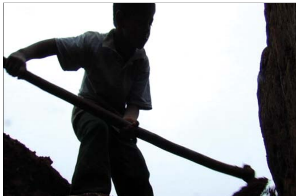
Arriba: Fotograma de Los herederos .

del sonido: un enorme crescendo de sonidos manipulados que conducen la película a su éxtasis metafórico, a un estado hiperbólico completamente despegado del objeto real: apenas una excusa para el desarrollo desbocado que aspira a condensar el alma agitada y contradictoria del mexicano. Esa secuencia es el epítome del proyecto cinematográfico de Polgovsky: un cine que toma asiento en lo real, en lo físico, para crear una experiencia en la que la política, la muerte y la vida se dan la mano antes de desvanecerse en el aire convulso de un documental en constante reescritura.