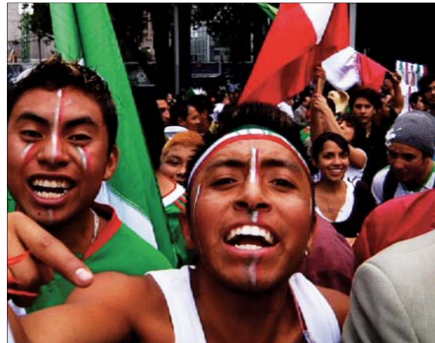
Fotogramas de Mitote (2012).

Podríamos vincular a Polgovsky con esa cohorte de cineastas y películas que han entendido al documental como una empresa caritativa, un intento de acallar las malas conciencias occidentales a través del retrato de las miserias del mundo. Cineastas que, como dice Mike Zryd, no hacen sino alimentar lo que él llama la «fantasía documental», esa idea tan extendida, y tan falsa, de que arreglamos los problemas del mundo viendo documentales sobre ellos. Y podríamos relacionar a Polgovsky con esa línea tan fructífera e inútil de películas biempensantes, pero estaríamos equivocados. Su cine pertenece a una estirpe mucho